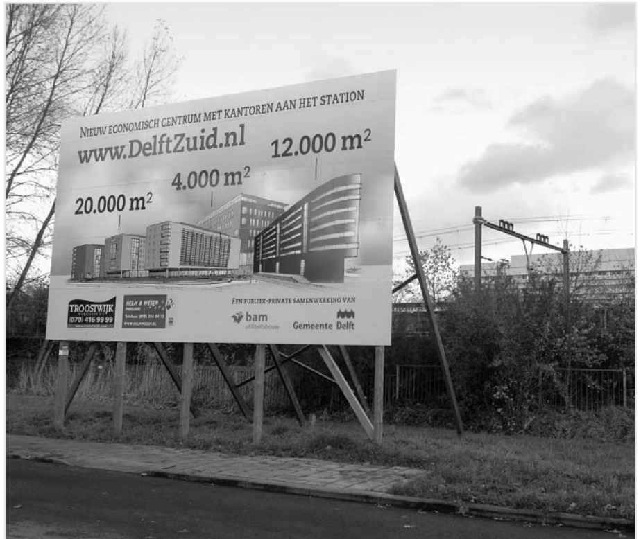
Bouwwerkzaamheden Station Zuid nog altijd niet begonnen

Het Belangenplatform Tanthof wenst een ieder een prettige jaarwisseling en voorspoedig en gezond 2007.