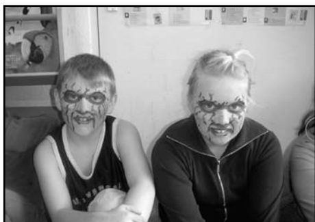
Scene uit de toneelvoorstelling>

< Heb je ooit zulke enge trollen gezien?