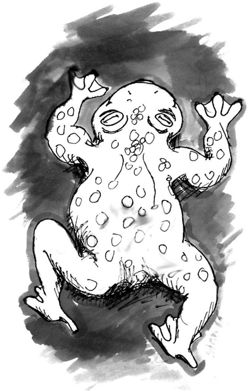
Illustratie: Stan van Aderichen

Frank Pacqué openingstijden: Geitenkamp 1 dinsdag 9-13 en 14-18 2623 BA Delft woensdag 9-13 en 14-18 015-2615969 donderdag 14-18 vrijdag 9-13 en 14-18